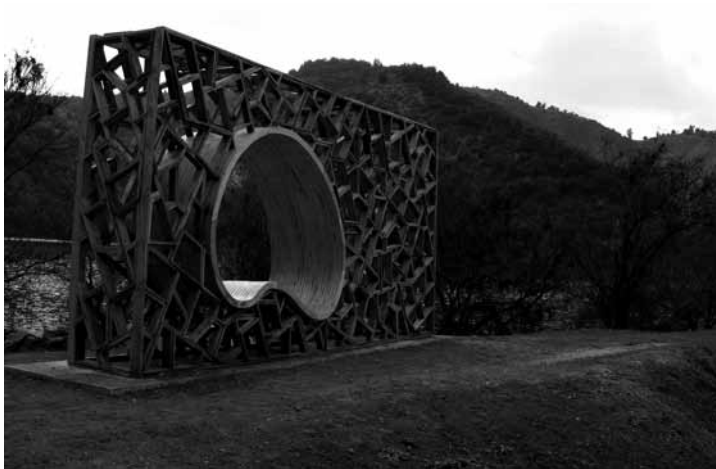
Figura 5. Obra de título: Landmark Ruta Secano Interior Costero de Osvaldo Veliz, Marcelo Valdés y Ronald Hernández. Hualaño, 2006.

5 La obra de título es una práctica académica que la Escuela de Arquitectura de la Universidad de Talca aplica desde el 2004, en la cual el proyecto de final de carrera consiste en la proyectación, gestión y construcción de una obra real por parte del estudiante.