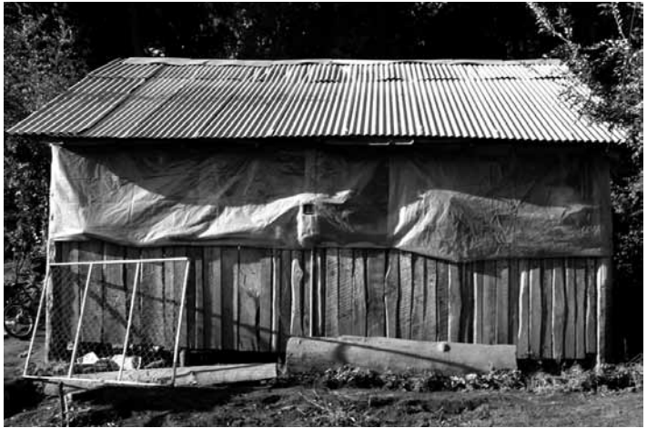
Figura 3. Gallinero en Pelarco.