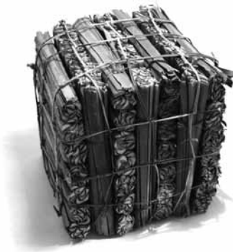
Figura 11. Cubo de materia.

Esa falta de recursos formativos y económicos se compensa a través de la cercanía y sensibilidad material que tienen los alumnos de la escuela de arquitectura. Un buen ejemplo es el ejercicio que debe desarrollar cada alumno durante el Taller de la Materia, en el Taller de Proyectos de primer año. El encargo consiste en que el alumno debe construir un cubo con materia del Valle Central, en un formato de 25 cm de arista (fig. 11). De esta manera, es posible realizar una primera aproximación material por parte de los alumnos mediante una serie de cubos confeccionados a partir de verduras, de ramas secas, de barro, de metal oxidado, de telas, de cuerdas, entre otros, que han ido ocupando distintos espacios en las distintas aulas de la escuela. Cada cubo habla de una relación particular del alumno-habitante con un sector del Valle Central de Chile y la materia que compone ese lugar. Cada cubo narra una particular manera de habitar el Valle Central de Chile. De esta manera es posible precisar el fuerte vínculo existente entre el habitante, su paisaje y su materia.