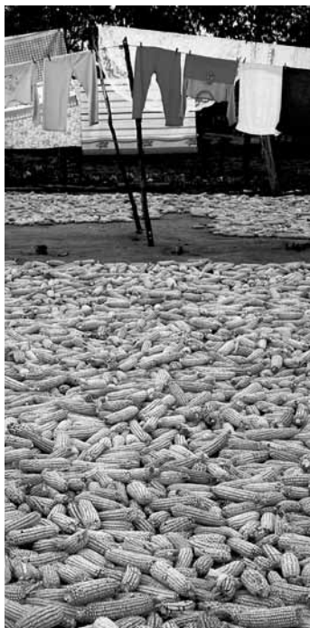
Figura 19. Proceso de secado de maíz en Pumanque, 2008.

A partir de esta nueva narrativa arquitectónica formulada por la Escuela de Arquitectura de la Universidad de Talca, se reconoce una nueva arquitectura llevada a la forma, mediante el reconocimiento y la reformulación, a ratos inconsciente, de diversas preexistencias de lo vernáculo, que entiende que el diseño arquitectónico empieza cuando nos damos cuenta de que cualquier forma de construir o de habitar está siempre sujeta al cambio y al perfeccionamiento, como consecuencia de la llegada de nuevos tiempos, costumbres, tecnologías y usos. Debido a esto último, es importante destacar cómo la nueva narrativa arquitectónica surgida en el Valle Central de Chile logra redescubrir y rehacer una serie de maneras de habitar; por ende, estira y renueva la serie de preexistencias arquitectónicas de las cuales se aferran para obtener las matrices de sus obras.