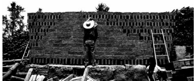
Figuras 12 y 13. Obra de título: Horno de ladrillo artesanal invertido de Diego Parra. Curicó, 2011. Fotografía: Diego Parra.