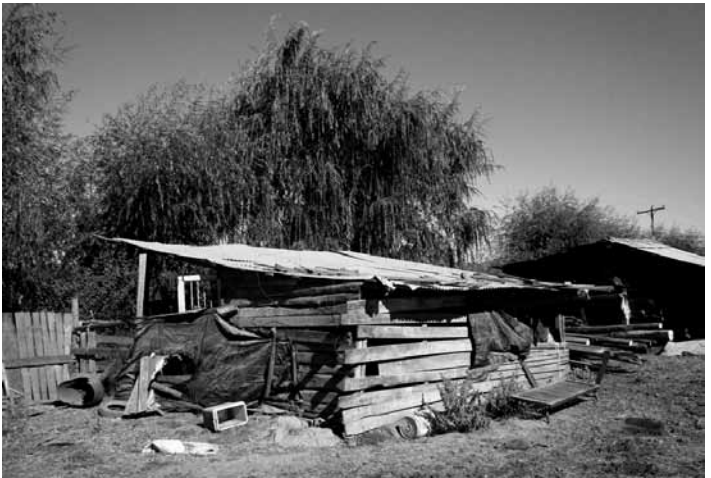
Figura 4. Bodega de herramientas en Corinto.