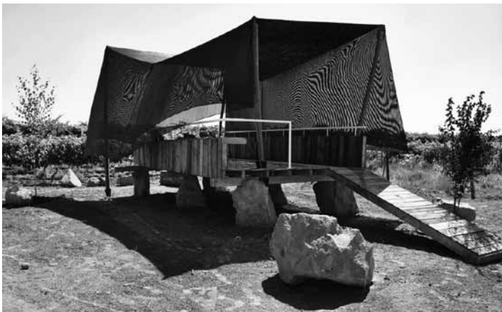
Figura 6. Obra de título: Mirador comedor emergente, de Javier Rodríguez. Los Niches, 2011.