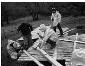
Figura 8. Proceso de construcción de la obra de título Tres paradores en el sendero de Chile , de Carlos Candia. Reserva Bellotos del Melado, 2004. Fotografía: Carlos Candia.