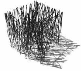
Figura 17. Cubo de materia.

Esta breve revisión de obras permite inferir que la gran mayoría de las obras construidas por los alumnos de la Escuela de Arquitectura de la Universidad de Talca tienen en común una condición asociada a la apropiación del lugar a partir de la extensión, debido a la íntima relación de los alumnos con la apertura del paisaje del Valle Central de Chile. De igual manera, es necesario comprender el fuerte vínculo que existe entre los autores de las obras y la condición material de la zona, pues los alumnos son hijos de la tierra, personas con una fuerte ligazón al contexto geográfico rural desde el cual provienen.