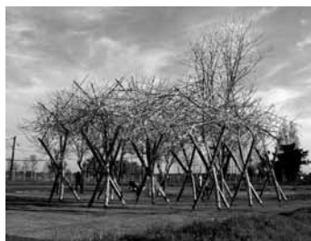
Figura 9. Cubierta de esferas de cañas , correspondiente al Taller de Obra. Panguilemo, 2008.