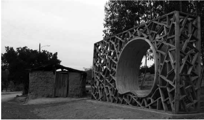
Figura 16. Obra de título: Landmark Ruta Secano Interior Costero de Osvaldo Veliz, Marcelo Valdés y Ronald Hernández. Hualañe, 2006.