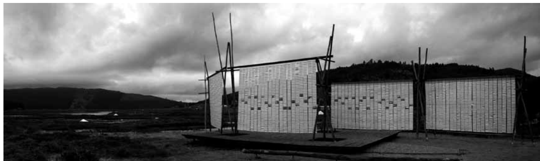
Figuras 14 y 15. Obra de título: Salineas, un lugar para la historia de Felipe Aranda. Lo Valdivia, 2011.