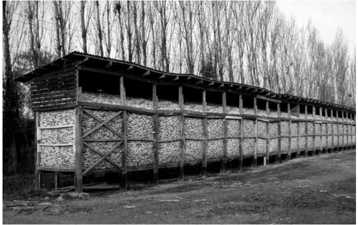
Figura 2. Bodega de acopio y secado de maíz en Batuco.