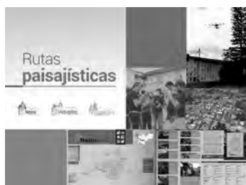
Figura 5. Rutas paisajísticas, ruta norte de Caldas.