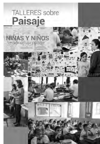
Figura 7. Talleres sobre paisaje y patrimonio en Neira, Salamina y Aguadas, Caldas.