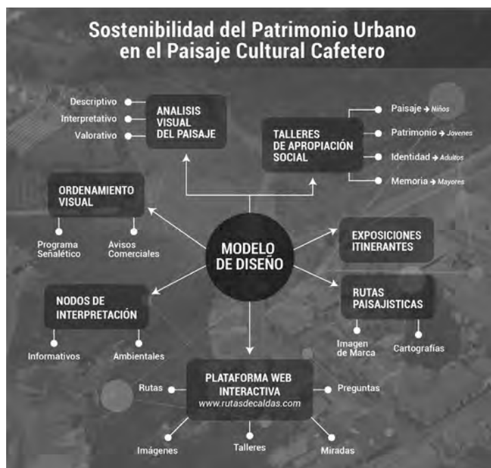
Figura 1. Mapa conceptual del modelo de diseño.

siones propias y el reconocimiento y valoración del espacio público por parte de los mismos habitantes. Los talleres se realizaron en los municipios de Neira, Salamina y Aguadas, en la ruta norte del Departamento de Caldas, los cuales permitieron de manera experimental validar la propuesta de la investigación que se propone ampliar a todo el PCC en etapas posteriores.