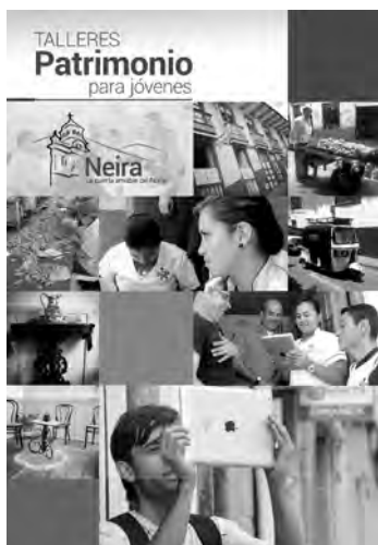
Figura 8. Talleres sobre identidad y memoria en Neira, Salamina y Aguadas, Caldas.

cuatro componentes de la identidad cultural local, como son: arquitectura, artesanía, folclor y comida tradicional, se realiza un trabajo de campo y se inicia la búsqueda de este tipo de expresiones con la comunidad para lo cual se requiere el registro de imágenes, sonidos y relatos con el uso del teléfono celular (fig. 8).