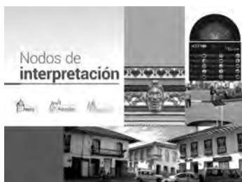
Figura 4. Nodos de interpretación en Neira, Salamina y Aguadas, Caldas.