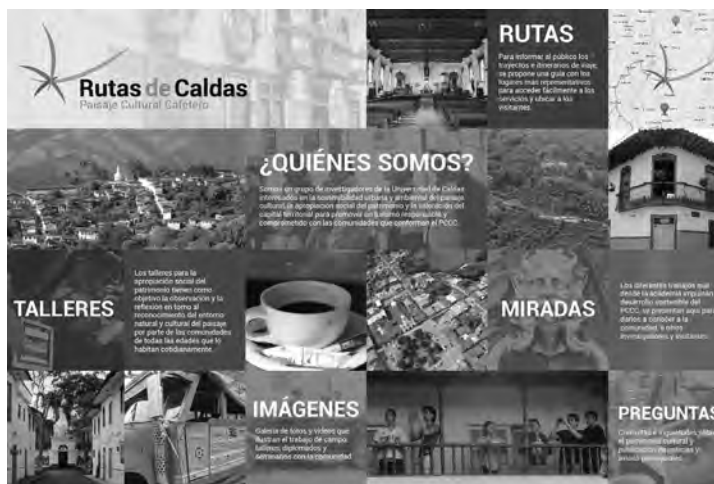
Figura 6. Plataforma web interactiva, rutas de Caldas.