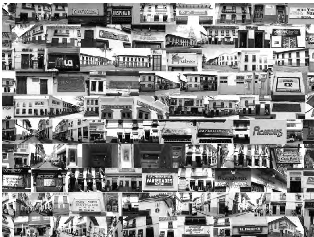
Figura 3. Avisos comerciales, Salamina, Caldas.