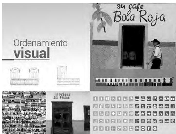
Figura 2. Ordenamiento visual en Neira, Salamina y Aguadas, Caldas.

El modelo de carácter experimental se implementó en la Ruta Norte de Caldas, que reúne las características de representatividad como