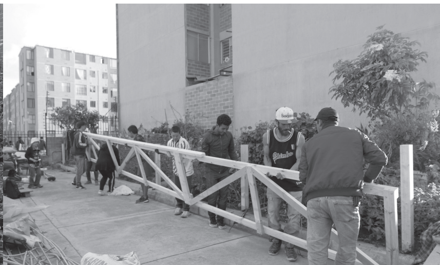
Fig. 8_ Apropiações cidadanas em zonas de afectación vial de la Avenida Longitudinal de Occidente sin desarrollar, 2020.