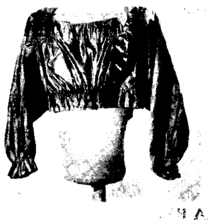
Casa Museo 20 de Julio.

ros. Con su industria se logró incrementar las exportaciones nacionales al tiempo que se produjeron atractivas ganancias para los intermediarios y un trabajo duro para las tejedoras, como lo describe el autor de un artículo publicado en 1869 en El Cóndor. "El (señor Ancízar) -se refiere a Manuel Ancízar en su publicación Peregrinación de Alpha- las vio de día, risueñas carialegres: nosotros las hemos visto de noche, encorvadas tristemente en derredor de un velón sin pantalla, trabando las pajas en silencio y cavilando tal vez en la triste condición de las mujeres pobres en nuestro país".