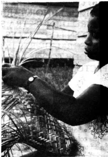
Cestería de Villa Contó.

El mundo de la cultura material es grande y diverso. Sin embargo, nos centraremos en el oficio textil, el cual está fuertemente enraizado en la cultura y en la vida cotidiana del ser humano, ya que ha sido el medio propicio para solucionar sus necesidades de cobijo, protección corporal e incluso alimento. Son innumerables las actividades diarias en las que el textil se involucra como herramienta, como solución, como auxiliar, como metáfora o como cultura viva. El textil es una actividad que forma parte de aquellos quehaceres del mundo cotidiano, en los cuales se producen objetos que conjugan la funcionalidad,