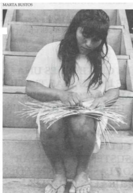
Mujer Huitoto, Puerto Milán. La Chorrera, Amazonas.

Al hablar con algunas cesteras negras, se refirieron a la cestería como algo propio, afirmando enfáticamente no haber aprendido el oficio de los diferentes grupos indígenas, con los que se han relacionado. Aseguran que, a pesar de que son las mismas técnicas e incluso los mismos materiales, sus productos son diferentes. Esto muestra el nivel de apropiación desarrollado dentro del grupo y confirma el proceso de reinterpretación de las técnicas, las formas y el manejo de materiales. Es importante anotar que la transferencia de conocimientos textiles, en este caso, se da, de mujer a mujer: el mundo femenino de una étnia, de una cultura, pasa a otra, enriqueciendo y transformando la tradición de ambos.