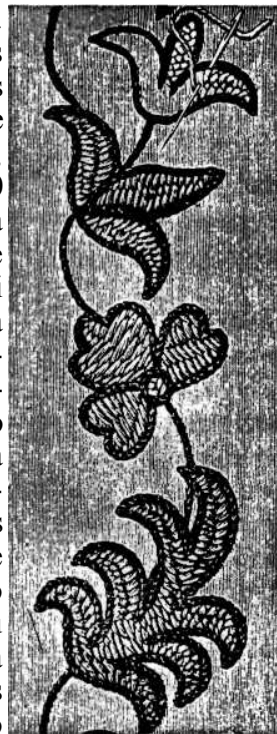
ENCICLOPEDIA DE LAS OBRERAS DE SEÑORA

Otro argumento de los empresarios para emplear mujeres era la creencia en su delicadeza manual: escogencia de materia prima, empaque de productos livianos, orga-