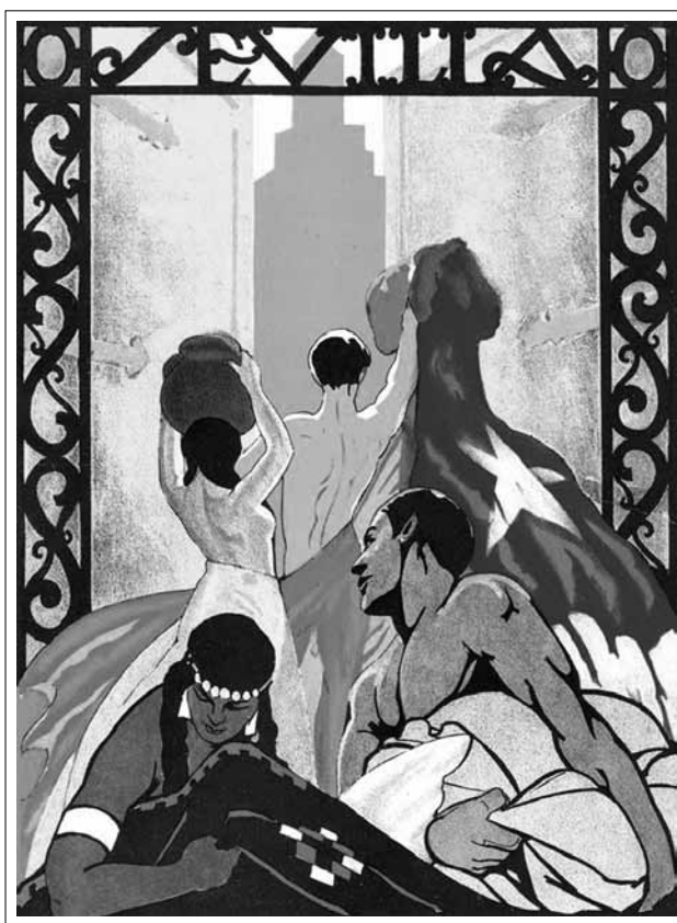
IMAGEN 5: ILUSTRACIÓN DE RAFAEL ALBERTO LÓPEZ PARA LA PORTADILLA DE LIBRO OFICIAL CHILE EN SEVILLA

Fuente: Aníbal Jara y Manuel Muirhead, Chile en Sevilla (Santiago: Cronos, 1929).