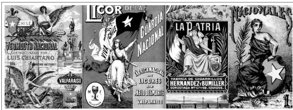
IMAGEN 1: MARCAS CHILENAS QUE HACÍAN ALUSIONES A LA PATRIA MEDIANTE SÍMBOLOS DE LA ICONOGRAFÍA REPUBLICANA FRANCESA A FINES DEL SIGLO XIX.

Fuente: Pedro Álvarez, Marca Registrada (Santiago: Ocho Libros Editores-Universidad del Pacífico, 2008).