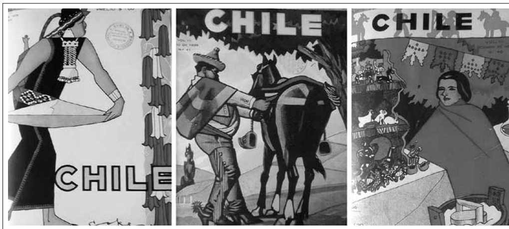
IMAGEN 2: PORTADAS DE LA REVISTA CHILE EN 1928 CON MOTIVOS INDÍGENAS Y POPULARES