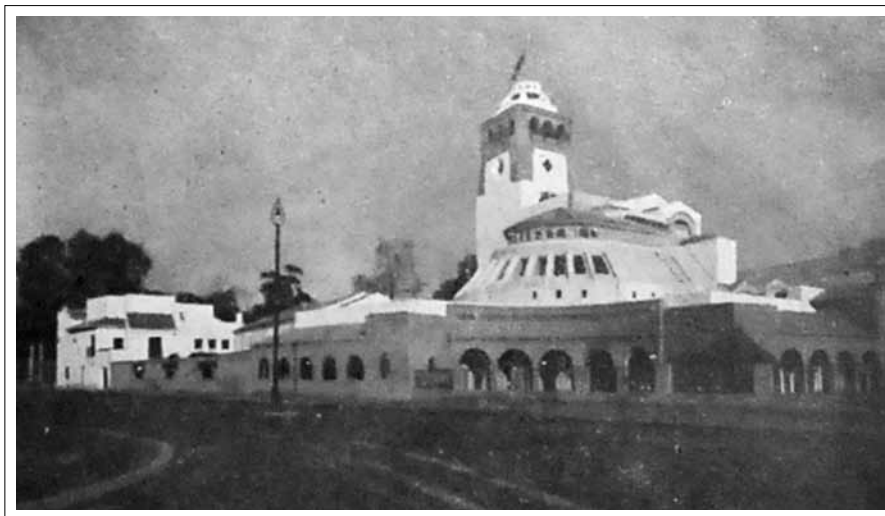
IMAGEN 6: PABELLÓN DE CHILE EN SEVILLA