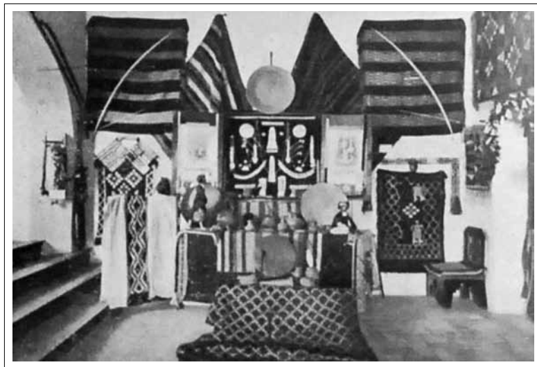
IMAGEN 4: SALA DE ARTE ARAUCANO