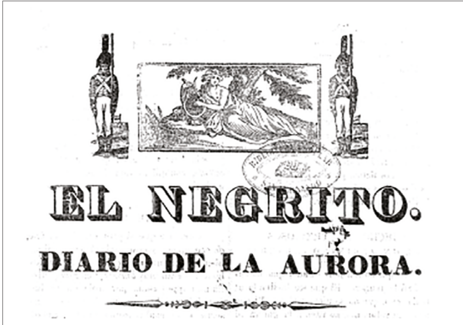
Figura 2. El Negrito N°. 1. Buenos Aires, 1833.

La polémica fue el terreno preferido de Luis Pérez: se enemistó con publicistas y ministros, federales lomo negro y unitarios de todo tipo. El periodo de auge de sus gacetas, entre mediados de 1830 y principios de 1834, coincidió con un momento de gran agitación al interior del partido federal. Tras la revolución unitaria y el fusilamiento de Dorrego en 1828, emerge un nuevo escenario caracterizado por la exclusión unitaria y la hegemonía federal, pero dentro del predominio federal operaban distintos grupos con notables diferencias entre sí: siguiendo a Herrero (“¿Qué partido federal?”), podemos apreciar la presencia de tres sectores: el grupo que el autor llama rosistas, sector acuerdista y moderado al que Pérez alude como lomo negro ; los dorreguistas o intransigentes, con quien Pérez tenía más simpatía, aunque su primera lealtad siempre estaba con Rosas, y por otro lado los miembros del unitarismo recientemente transformados en federales. Este escenario de disputas exacerbaba el carácter polémico de Pérez que, a través de sus gacetas, atacaba a propios y ajenos, excluyendo de sus predicamentos solo a dos líderes: Dorrego y Rosas. A través de sus publicaciones, Pérez buscaba pronunciar el clima de controversias y persecución a opositores, pensando su labor periodística como plataforma para la generación de hechos políticos. Luis Pérez no vio en la prensa solo el instrumento con el que alcanzar y persuadir paisanos, sino que encontró en sus modos