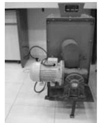
figura 2 micromezcladora helicoidal

Para viscosidades bajas como de 30 y 40cp, las cápsulas obtenidas tuvieron un diámetro promedio de 4mm y una forma bastante irregular e indefinida. Aparentemente se veían masas aglomeradas que no eran similares entre sí de color transparente. Sin