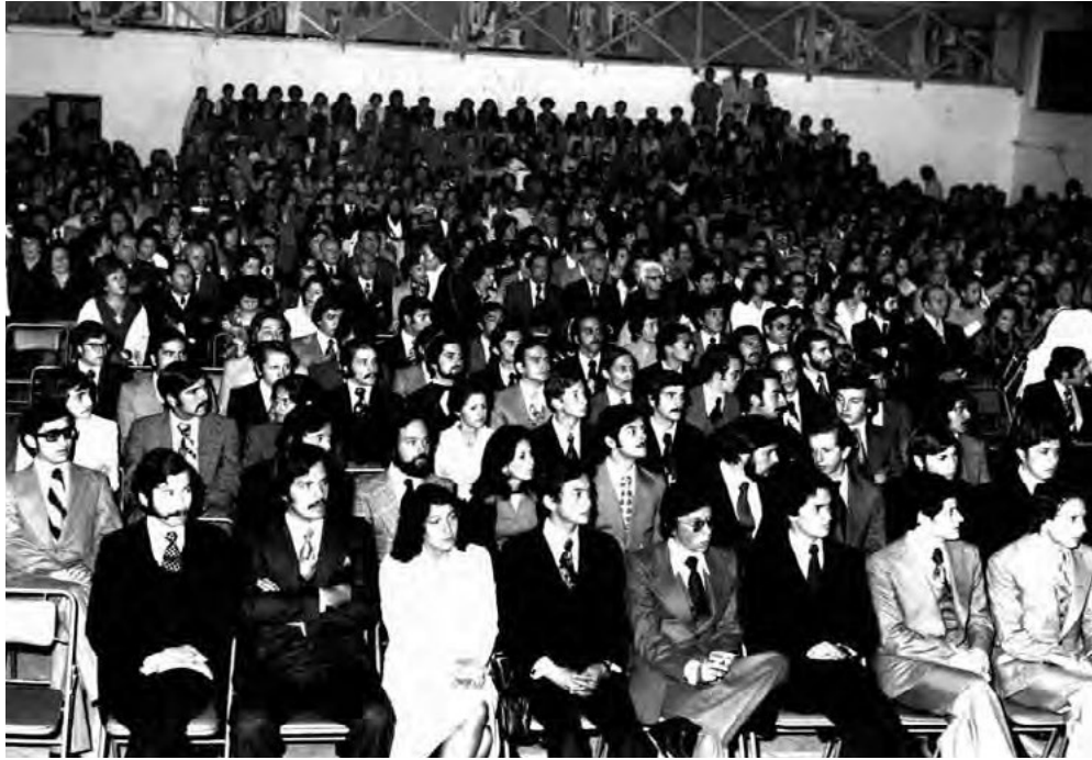
Ceremonia de graduación, 1970.