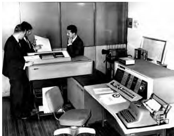
Computador IBM-1130.