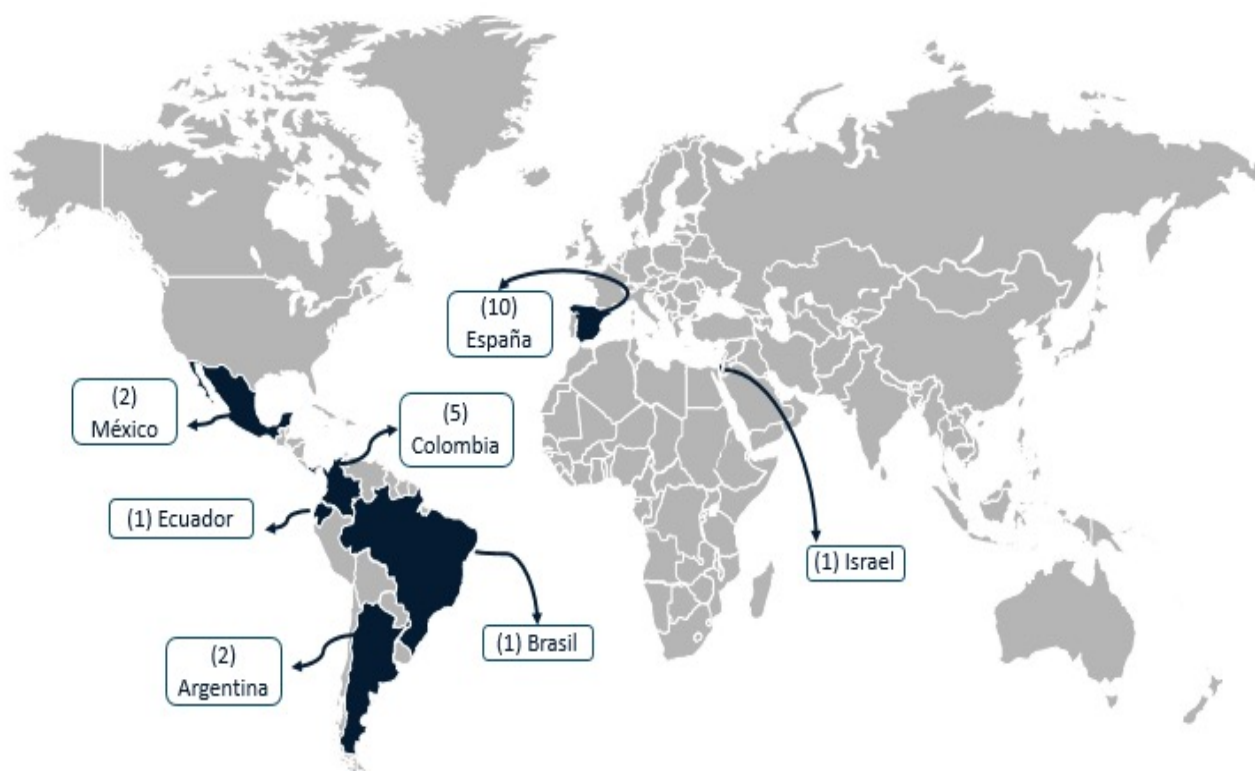
Figura 2. Ubicación de antecedentes de acuerdo con país de origen

Así mismo, se evidenció en los últimos años una preocupación creciente por el papel de la familia y, de manera específica, las formas de relación parental en los procesos de aprendizaje y el desarrollo infantil en general (véase la figura 3). Sin embargo, continúan siendo pocos los estudios que relacionen a los EEF como factor de riesgo o protección en el curso y pronóstico del TDAH.