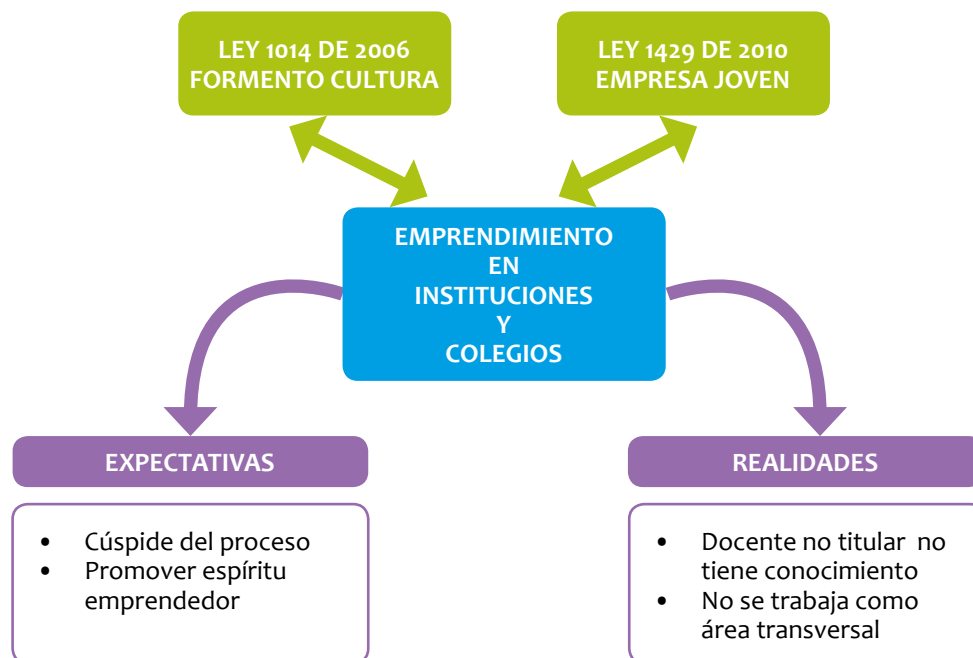
Figura 3. Situación del trabajo en emprendimiento: Expectativas y realidades